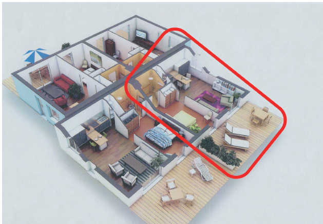
Exemple d'un T2 de 46 m 2 avec terrasse

Idéalement implantée, dans un écrin de verdure du pays Bucheois et facilement accessible par la Route de Rocquemont, à 7 min. de l'A28, la Résidence est composée de logements plain-pied indépendants, groupés par 4 ou 5, dans des constructions récentes adaptés aux personnes à mobilité réduite.